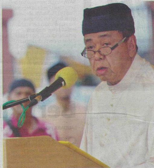
SULTAN SHARAFUDDIN menaikan yang diperlukan oleh orang Melayu pada ketika ini adalah perpaduan yang erat antara orang Melayu terutama dalam kalangan pemimpin Melayu dan rakyat berketurunan Melayu.

Kita perlu akui tentang kelemahan yang ada pada orang Melayu namun kelemahan ini boleh diatasi jika sekiranya di kalangan orang Melayu ditanam dengan sikap berbaik sangka, tiada dengki khianat, tiada