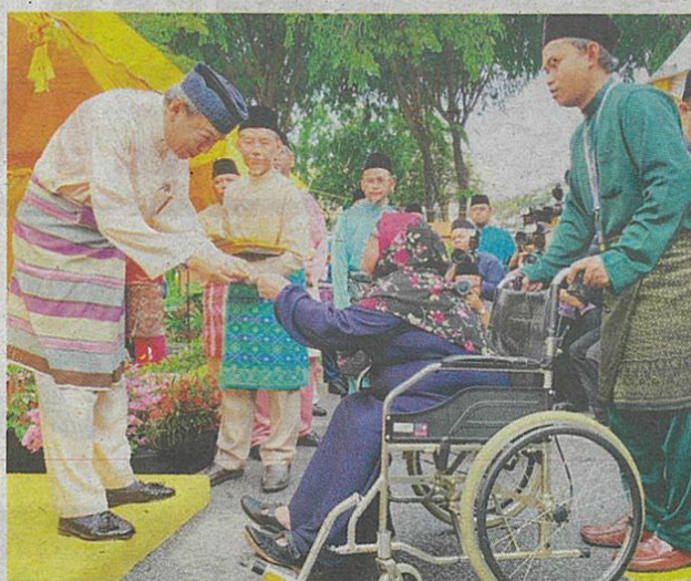
Sultan Sharafuddin berkenan menyampaikan sumbangan Hari Raya Aidilfitri berjumlah RM198,000 kepada asnaf fakir, miskin dan mualaf semalam.

Sultan Sharafuddin dan rakyat kemudiannya diperdengarkan bacaan ayat-ayat suci al-Quran sebelum berbuka puasa dan seterusnya menunaikan solat Maghrib, Isyak dan tarawih.