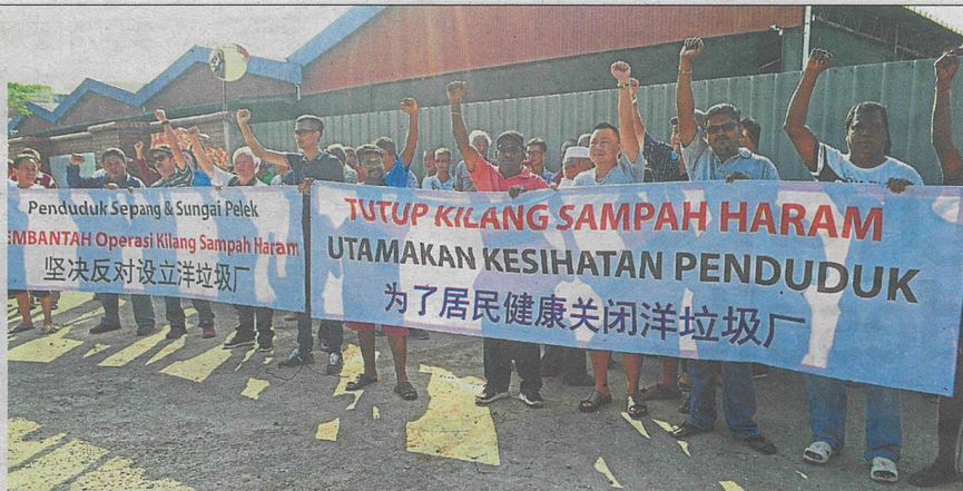
Residents from five villages held a peaceful demonstration against the plastic processing factory.

But not long after, residents started to hear machinery noises coming from the factory at night.