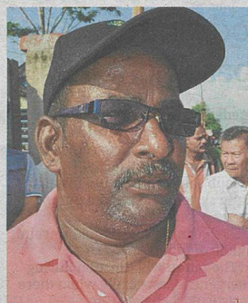
Raman says the factory fumes can be detected up to a seven-kilometre radius.