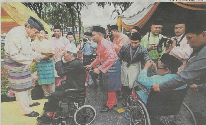
Sultan Sharafuddin berkenan menyampaikan sumbangan hari raya kepada fakir miskin dan saudara baharu di Masjid Taman Sri Muda Seksyen 25 Shah Alam, semalam.

Sultan Selangor bertitah, jika orang Melayu berpecah dan hidup dalam keadaan porak-peranda, ada pihak yang mendapat keuntungan, sekali gus menyebabkan Melayu akan hilang segala-galanya, baik dari segi hak beragama, ekonomi, politik dan pendidikan.