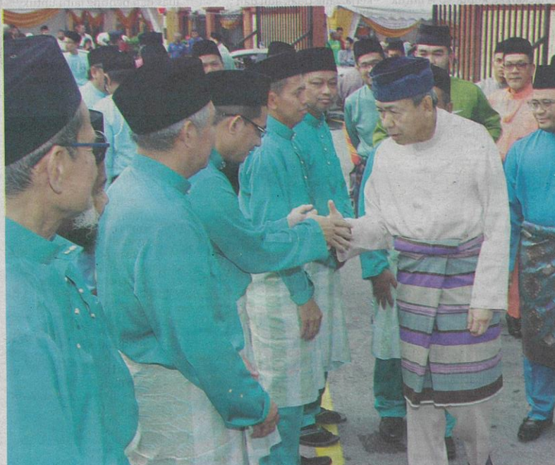
SULTAN SHARAFUDDIN bersalaman dengan rakyat Selangor sebelum merasmikan Masjid Taman Seri Muda di Shah Alam.

Maka dengan lafaz Bismillahir Rahmanir Rahim, Beta dengan sukacitanya merasmikan Masjid ini dengan nama Masjid Taman Seri Muda. 19