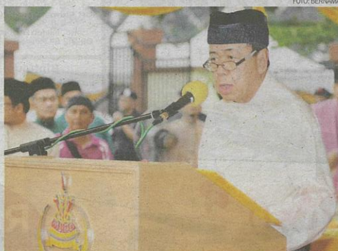
Sultan Selangor Sultan Sharafuddin Idris Shah menyeru orang Melayu bersatu-padu agar menjadi satu bangsa yang kuat, bermaruah dan bermatlamat demi kepentingan agama, bangsa dan negara.

Perbalahan ini mencakupi semua aspek sehingga perkara kecil pun dijadikan punca dan kemudiannya mengakibatkan perpecahan yang semakin ketara. Gejala fitnah-memfitnah antara satu pihak dengan pihak yang lain serta pe-