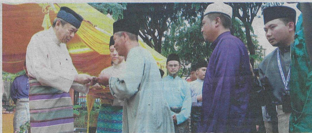
SULTAN SHARAFUDDIN IDRIS SHAH menyampaikan sumbangan Hari Raya Aidilfitri kepada penerima sempena majlis berbuka puasa bersama rakyat jelata dan penyampaian sumbangan hari raya kepada fakir, miskin dan saudara baru di Masjid Taman Seri Muda, Shah Alam, Selangor, semalam.